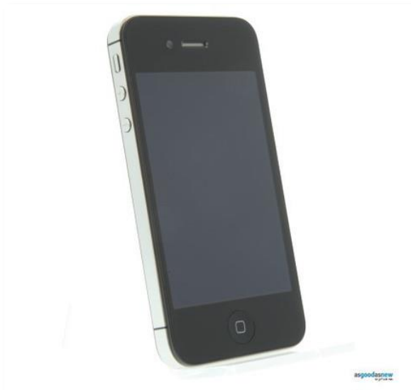
So gut sieht so gut wie neu aus.

Momentan werden rund 20.000 CE-Geräte monatlich durch das Unternehmen angekauft, professionell generalüberholt (= refurbished) und verkauft.