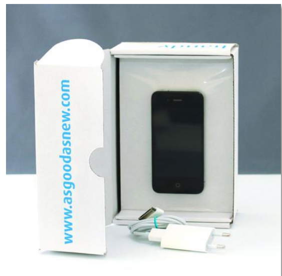
In der hochwertigen asgoodasnew-Versandbox ist das passende Ladegerät immer auch enthalten.

Auf der Verkaufseite www.asgoodasnew.com können aktuell Hunderte verschiedener Handy- und Smartphone-Modelle aus den letzten drei Jahren gekauft werden. Außerdem findet der