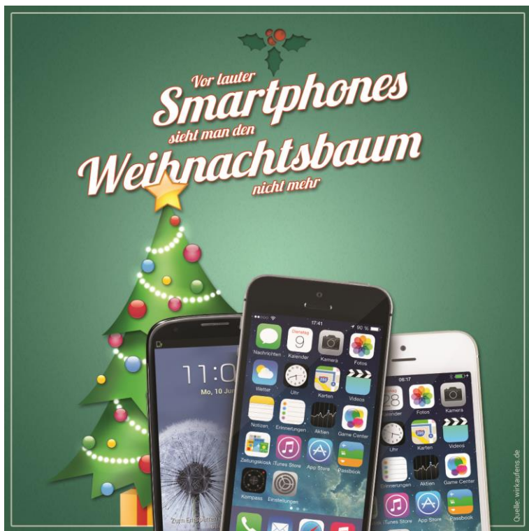
Grafik: Vor lauter Smartphones sieht man den Weihnachtsbaum nicht mehr